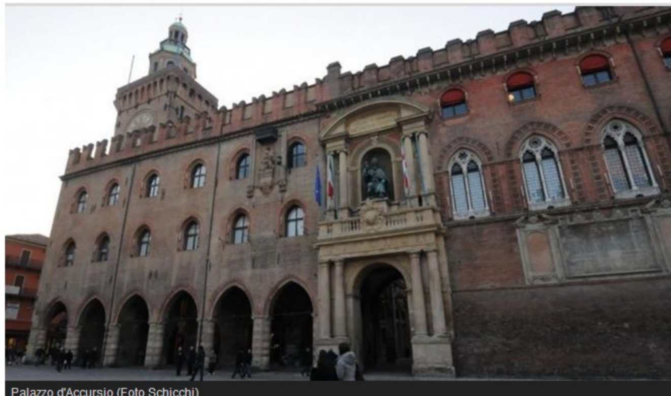
Palazzo d'Accursio

Bologna, 17 maggio 2012 - Più multe, col potenziamento di tutti i sistemi di telecontrollo adottati sotto le Due Torri, da Rita ai semafori Stars. E' una linea che emerge chiara dal budget 2012 e dagli altri allegati di bilancio varati dalla giunta Merola e dalla prossima settimana all'esame del Consiglio.